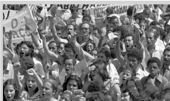
Greve dos Professores em Belo Horizonte - 1979

Com as greves dos metalúrgicos de BH-Contagem-Betim surge o grupo Marreta que estenderá a sua atuação entre os rodoviários e operários da construção civil. É nesse processo que surge o grupo Marreta, composto dos operários mais conscientes de diversas categorias profissionais da classe . O grupo Marreta na Construção Civil se organizou no fogo da luta de nossa histórica greve de 1979, se opondo ao peleguismo do interventor Francisco Pizarro, lutando por melhores condições e contra o regime militar-fascista no Sindicato.