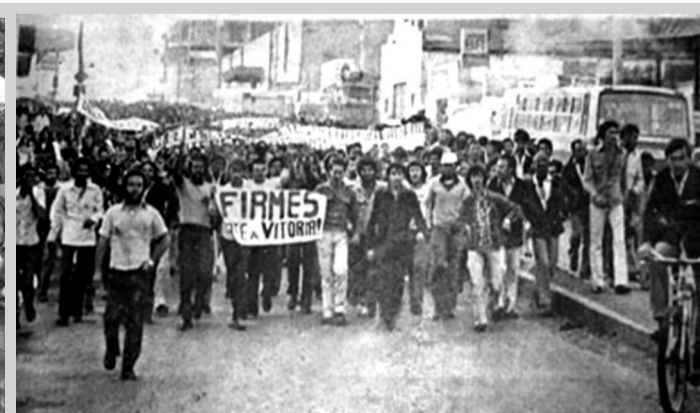
Operários da Mannesman em passeata - 1979