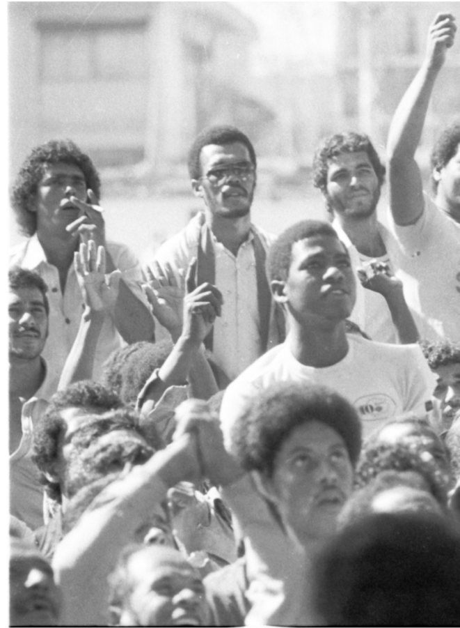
Operários da construção civil de Belo Horizonte.

No segundo dia de greve, após a surra que a PM levou dos operários, provocadores do regime militar (extrema-direita) distribuíram cachaça para promover quebradeira na cidade e demonstrar descontentamento com o general Figueiredo que tinha indicado para governador Francelino Pereira e não o candidato da extrema-direita Murilo Badaró e para jogar a opinião pública contra a greve. Os operários seguem em fúria, o governador Francelino Pereira ordenou maior repressão, pedindo reforço militar de outras cidades. O comércio fechou as portas, o transporte parou de rodar no centro da cidade. Nas ruas, os operários passavam como tsunami, parando tudo com sua justa fúria. Os monopólios de imprensa anunciam pelas rádios e TV’s, para a população “não sair às ruas”, criminalizando os operários, acusando-os de estarem seguindo subversivos e de que “estão incontroláveis, violentos e promovendo