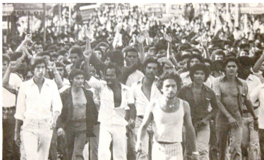
Operários da Mannesman em agitam as ruas do Barreiro região fabril de BH (greve de 1979)

No dia 17 de abril de 1979 aconteceu o “ Dia Nacional de Lutas ”, algumas categorias aderem, mas não totalmente. Esses fatos precedem e preparam novas e